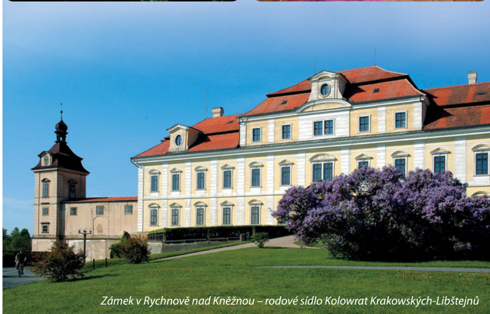
Zámek v Rychnově nad Kněžnou – rodové sídlo Kolowrat Krakowských-Libštejnů