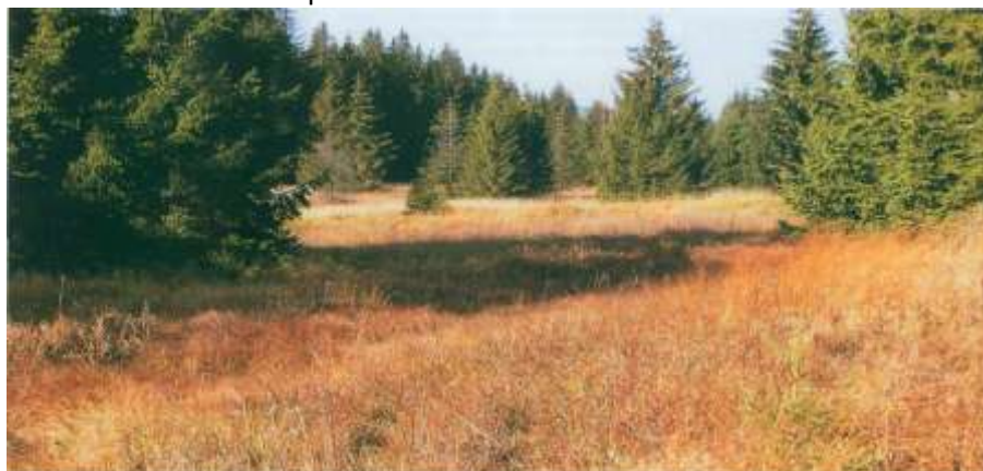
Samovolně vzniklé lesy v přírodní památce Pestřice.

Výsledkem těchto známých událostí bylo vysídlené území, odříznuté od Rakouska státní hranicí, od Čech střeženou signální stěnou, doplněnou navíc Lipenskou nádrží, která zatopila téměř všechny přístupové komunikace. Hospodaření „za dráty" bylo omezeno na občasnou sklizeň luk a extenzivní hospodaření v lesích. Příroda nabídnutou možnost dokonale využila a dokázala, že bezlesí v krajině je jen dočasné. Zůstala zachována struktura krajiny - síť polních a lesních cest, tarasů a mezí, mozaika ploch lesů, luk a mokřadů. Rychle zanikla odvodňovací síť ručně udržovaných stružek a z části pozemků se opět staly slatiny a mokřady. Na nesklízené plochy se začaly vracet keře a stromy — zpočátku vrby, břízy, později i jehličnany. Izolace území měla i dobré stránky. Použití chemických přípravků se omezilo na udržování pásů kolem signální stěny, hnojení a vápnění bylo téměř nulové. Nedošlo k plošnému rozorávání a likvidaci citlivých druhů.