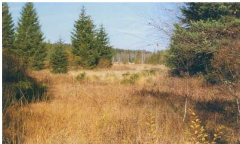
Rozptýlené nálety dřevin vytvářejí mozaiku rozmanitých společenstev.

Z nedalekého Svatotomášského pohoří se do vznikající tajgy občas zatoulá los, objevují se stopy rysa. Vzniká tak „divočina“, na první pohled k člověku nepřívětivá (protože se chová jinak, než návštěvník