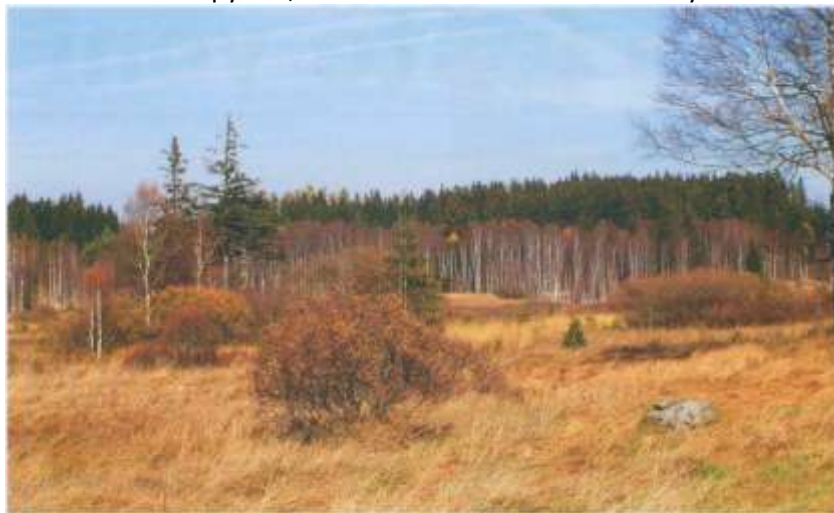
Ladem ležící plochy v přírodní památce Házlův Kříž.

Mělká terénní deprese, plošně podmáčená vodou z řady pramenů, které vyvěrají na bocích údolí. Na prameništích jsou zachována drobná rašeliniště, voda obsahuje minimum živin. Prameniště si udržují vzhled údolního rašeliniště s keříky vlochyň, klikvou a vřesem. Na sušších plochách se udržují trávníky s převahou bezkolence nebo smilky, vlhčí plochy jsou porostlé nízkými ostřicemi, suchopýrem, rašeliníkem a dalšími mechorosty.