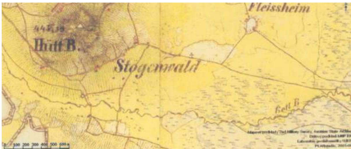
Pestřice - Stögenwald