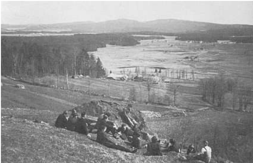
Pohled z Pestřice na Vítkův kámen