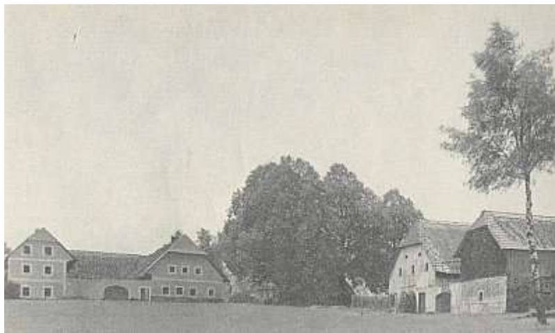
Část obce Pestřice zv. Sklářská Huť