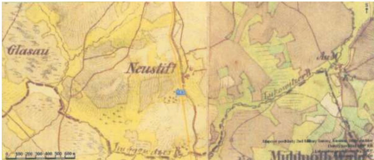
Nová Lhota - Neustift

Poloha osady Nová Lhota = zem. šířka 48,70472 zem. délka 14,13722