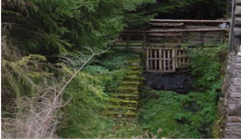
Další tři obrázky – na posledním náhon, kde bývalo mlýnské kolo