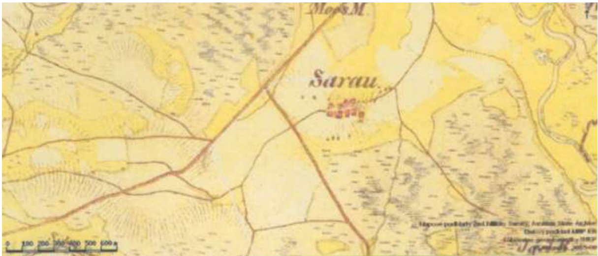
Kyselov - Sarau