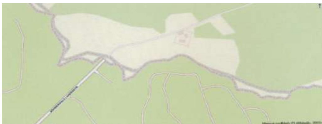
Plánek Kyselova – cesta ke státní hranici – současný stav 2008