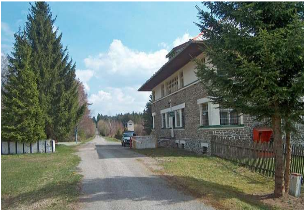
Bývalá rota PS Kyselov