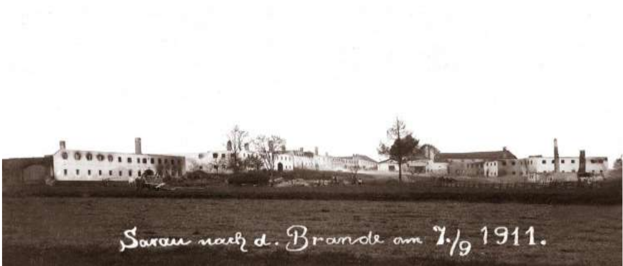
Kyselov po požáru v r. 1911