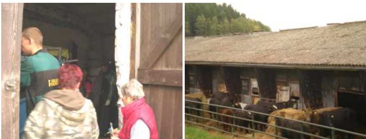
Uvnitř očkuje MVDr. Duda