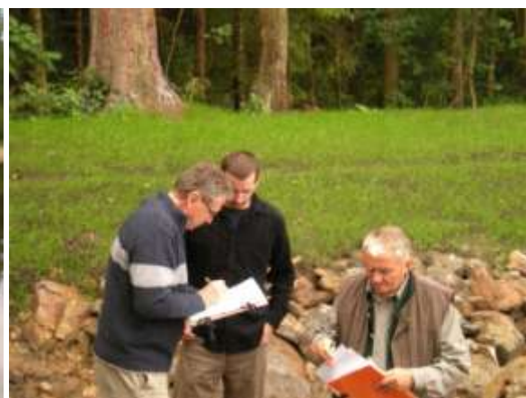
Poslední kontrola, poslední podpisy

Vlastní kolaudace se všemi potřebnými podpisy pak proběhla v Chlumu u Třeboně, v restauraci „U Růženky“, kde bylo podáno slavnostní občerstvení.