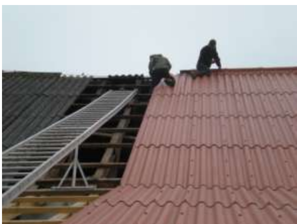
Současně probíhá výměna střešní krytiny