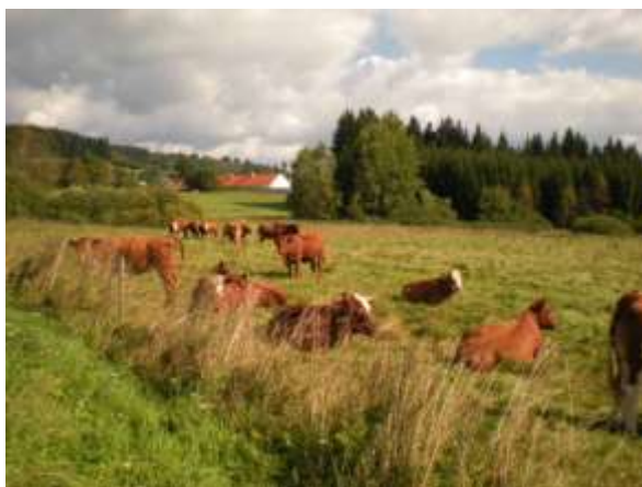
Na pastvině Za Badáněm se pásli dobytek ve skupinkách Na Muckově oproti „kovárně“ vládla rovněž pohoda ( veškeré foto k této části 18. 8. – F.Z.)