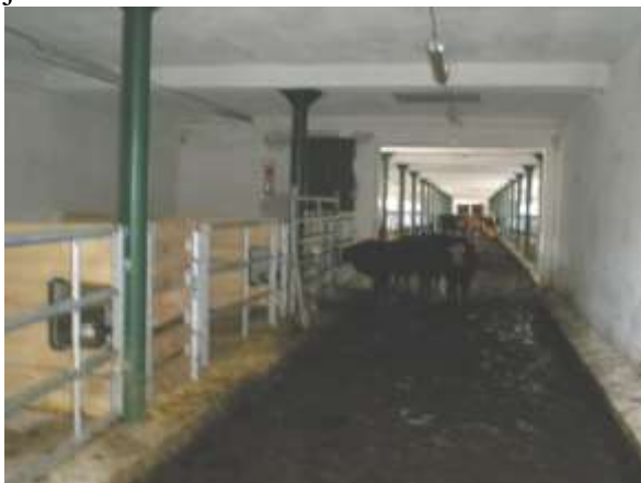
Býčci jsou připraveni ve stáji

Vzhledem k větším vloženým finančním nákladům do probíhajících investic, potřebuje firma větší zdroje a tak je nutno prodat do konce roku více dobytka, než se původně předpokládalo. Z více než 400 plánovaných kusů je zatím prodána asi polovina a tak jsou další prodeje připraveny. Dne 4. listopadu firma prodala celkem 80 ks výkrmových býčků ze stáje na Muckově, které naložil v podvečerních hodinách kamion s přívěsem, určeny byly pro zákazníka z Čech / viz další foto/. Dále je ještě ve firmě připraven prodej 55 krav a 50 kusů jalovic.