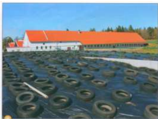
Siláže jsou již připraveny pro zimní krmení

dojde ke znehodnocení porostu a ten pak potřebuje celé jaro na regeneraci. Z těchto důvodů jsme se začali zabývat otázkou rekonstrukce stájí (kterých je v podniku celkem sedm) na zimoviště. Jednalo se o kraviny typů K96 a K102 staré 40 až 55 let a některé již v havarijním stavu.