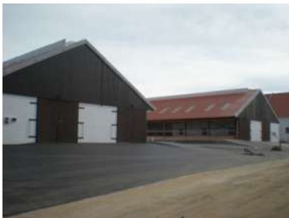
Konečná úprava zrekonstruovaných stájí č. 1 a 2 na Milné