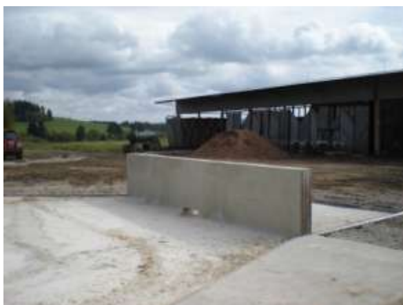
Hotové je i venkovní plato na chlévskou mrvu