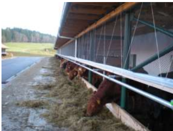
Probíhá krmení senáží v krmištích stáji č.1 a 2