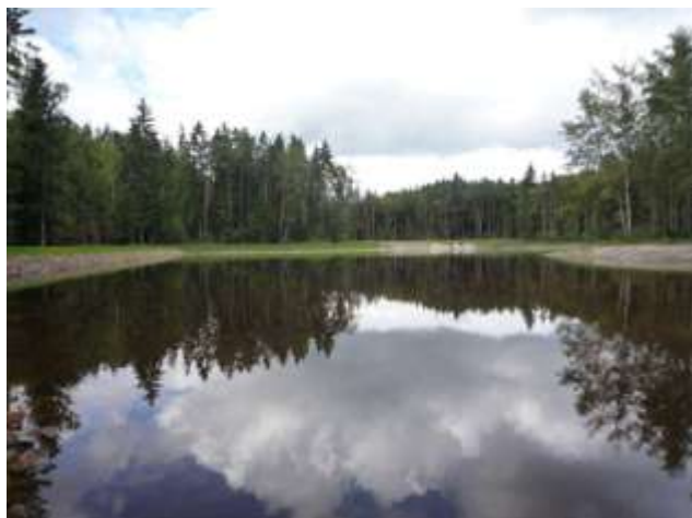
Pohled na rybník