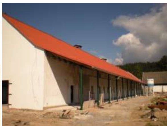
Práce pokračují i na Muckově ( veškeré foto k této části 18.9 – F.Z.)