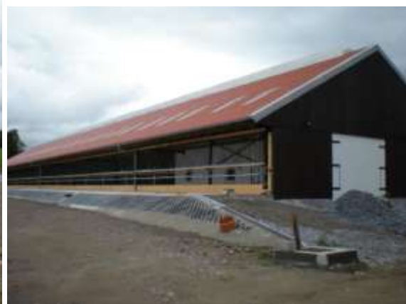
Stáje č. 1 a č. 2 na Milné