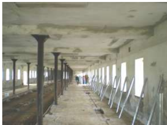
Ve stáji na Muckově vyrostl směrem do dvora přístřešek Uvnitř připravené zábrany čekají na zabetonování