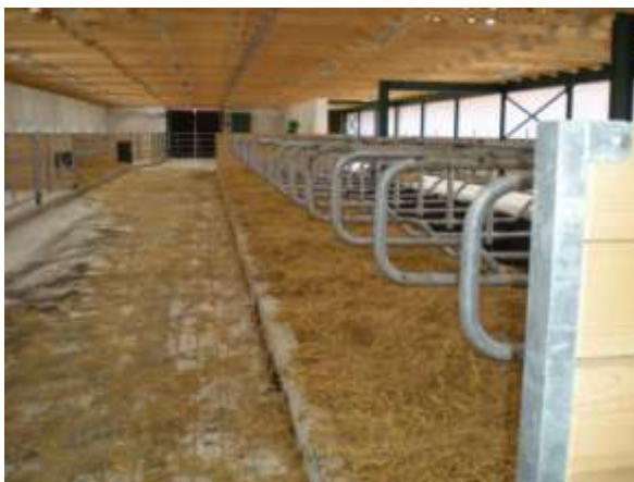
Nejdříve přijde vrstva chlévské mrvy, na ní pak vrstva slámy