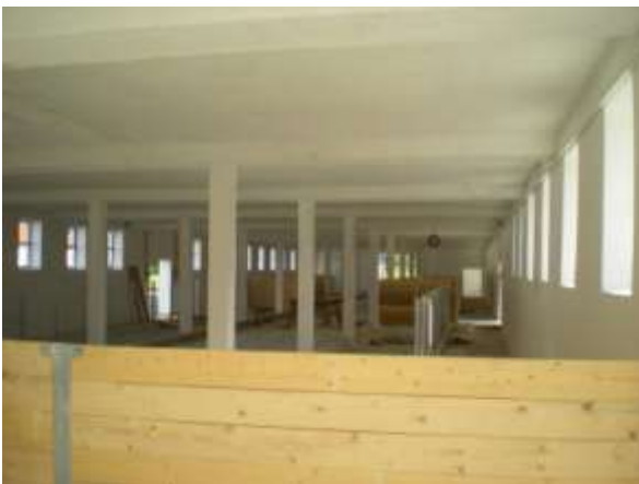
U stáje č. 3 na Milné se v těchto dnech montuje venkovní přístřešek z pravé strany stáje a uvnitř pracovníci zabudovávají navrženou technologii ( 16.8 – F.Z.)