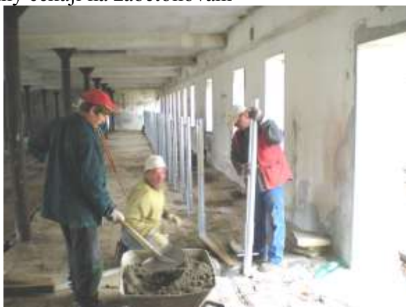
Pro přípravu vnitřního prostoru je nutno vše řádně změřit Pracovníci FAO,s.r.o. při zabetonování zábran ( vše 6. 8. – F.Z. )