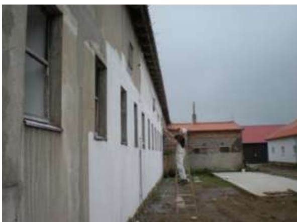
Stáj je nutno nabílit i zvenku