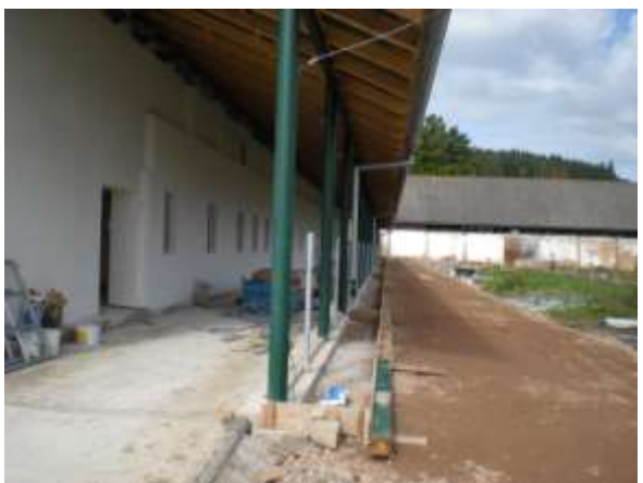
Venkovní prostory kolem stáje jsou ještě ve fázi rozpracovanosti / veškeré foto 2. 10. F. Z. )