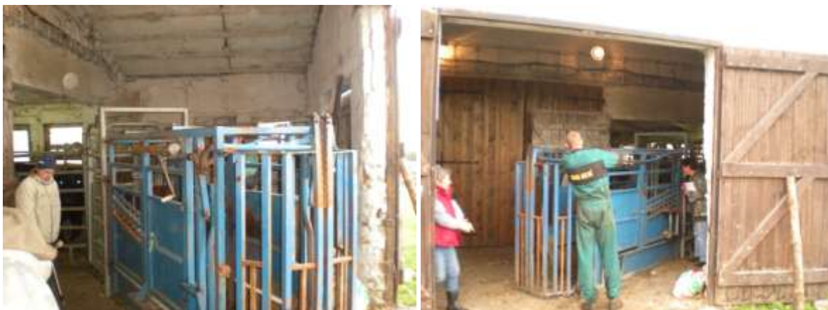
Zvířata byla shromážděna ve stáji a pak každé jednotlivě nahnáno do klece, kde obdrželo potřebnou vakcinu

Očkovat se začalo v roce 2008, počítalo se s trváním tří let, takže zřejmě letos by to bylo naposledy.