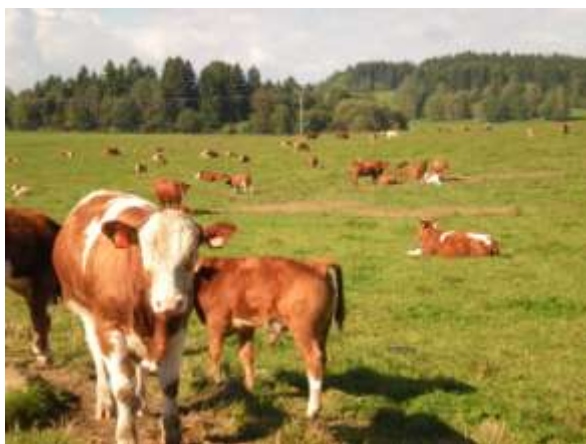
Prakticky téměř stejně se chovala zvířata na pastvinách ve směru na Kovářov vlevo i vpravo