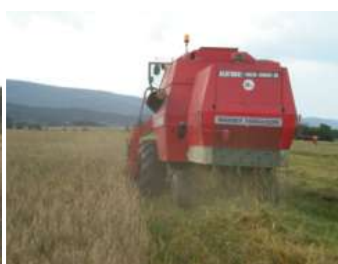
Kombajn se znovu zakousl do porostu a výmlat Tritikale mohl pokračovat