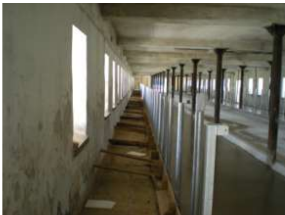
Stejně tak i na druhé straně