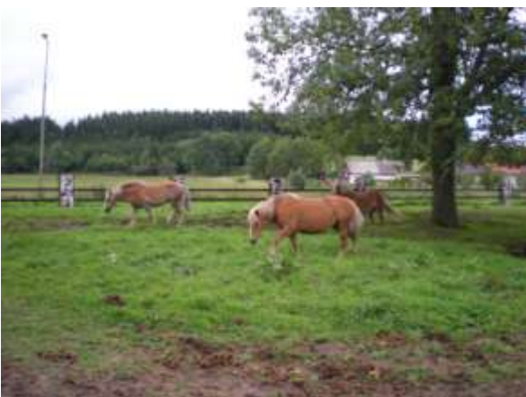
Všechny tři koně jsou zde ve výběhu spokojené