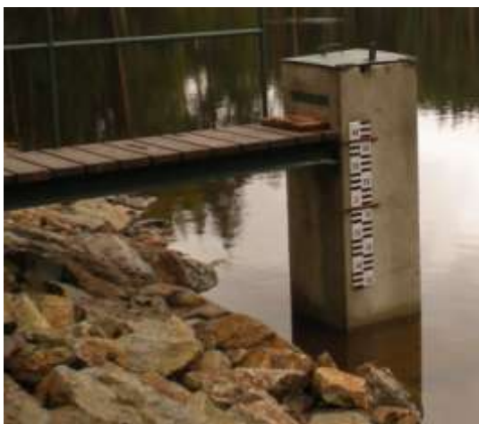
Stav hladiny v porovnání s měřičem

Poněkud pomalejší je přítok vody a tudíž v současné době chybí do normálu 70 cm.