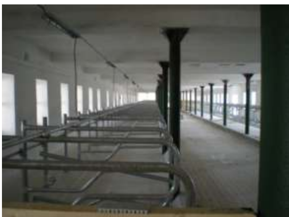
Vnitřní technologie je zabudovaná

Naposledy jsem zachytil práce na rekonstrukci muckovské stáje dne 23. září, tehdy se betonovalo uvnitř, aby mohla být vestavěna veškerá potřebná technologie, jak práce pokročily ukazují současné snímky.