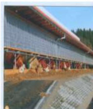
Lisopad 2010 – první krávy čekají svůj zimní domov

Po zhlédnutí několika menších objektů v Německu jsme začali připravovat projekt. Volba padla na stítný provoz, který považujeme za nejvhodnější z hlediska welfare. Významná je produkce hnoje, kterého si vážeme jako nejvýznamnějšího prostředku k udržení půdní úrodnosti.