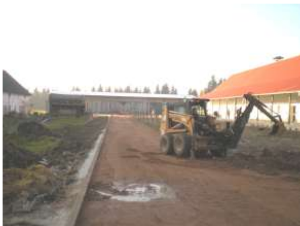
Tyto snímky jsou opět o něco pozdější – práce pokračují zejména na úpravě venkovního prostoru / 10. 10 – F. Z./