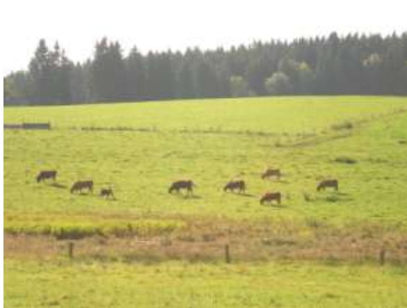
Pod stájí č. 3 na Milné všechen dobytek spokojeně ležel a odpočíval Na pastvině v blízkosti Kalvárie se zase spokojeně pásli