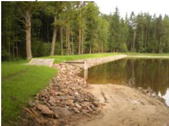
Pečlivě složená kamenná hráz rybníka

Bylo konstatováno, že celá stavba proběhla bez problémů a vad, plynule a bez časových prodlev. Zejména bylo oceněno, že hráz rybníka je vytvořena perfektně sestavenými kameny a to, že byl vytvořen z bývalého poloostrova nový ostrůvek, který dotváří celou přírodní scenérii rybníka.