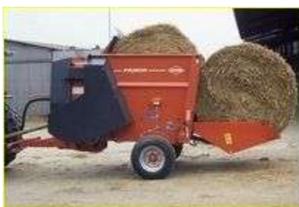
Jan Fleišman připraven s nastýlacím vozem Primor Nastýlací vůz připraven s dvěma balíky slámy

Nastýlací vůz PRIMOR 2060 H od firmy KUHN, je univerzální nesený vůz pro podestýlání a zakládání krmiva. Ventilátor o průměru 1,55 m a pneumatické separační komory umožňují rovnoměrné zakládání slámy, kterou lze foukat až do vzdálenosti 18 m doprava a 16 m doleva.