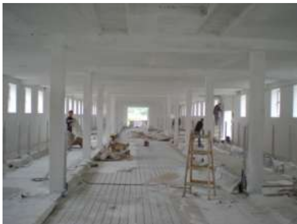
Stáj č. 3 je již vybělená, dokončují se poslední úpravy, odstraňuje se zakrývací fólie ( 6.8-F.Z.)