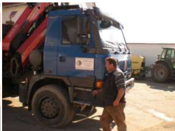
U auta pracovník FAO Václav Svoboda