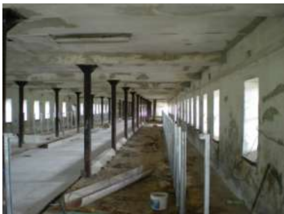
Stejně tak pokračují práce na rekonstrukci stáje na farmě Muckov – zabudovávání vnitřní technologie