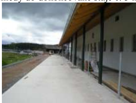
Pohled pod přístřeškem u č. 3