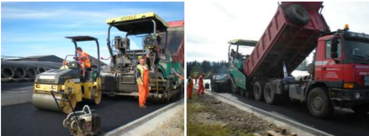
Provádí se konečná asfaltová úprava kolem senážního plata

Společnost Swietelsky, stavební s.r.o. provádí v celém areálu poslední asfaltovou úpravu prostranství a příjezdových cest, úprava se týká i okolí zrekonstruovaného senážního žlabu.