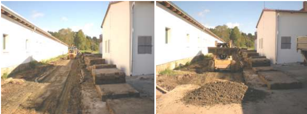
Firma FAO, s.r.o. Frymburk pokračuje v úpravě mezi stájemi č. 2 a 3

Hlavní rekonstrukční práce uvnitř stájí jsou prakticky hotovy, nyní se připravuje a dokončuje úprava kolem objektů. Veškeré prostory kolem stájí, příslušné vozovky i prostor kolem senážních jam bude do kolaudace vyasfaltován.