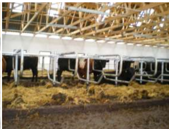
Umístění v boxech