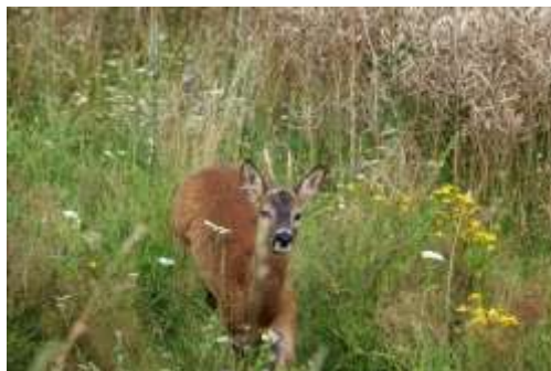
Ilustrační obrázky z internetu