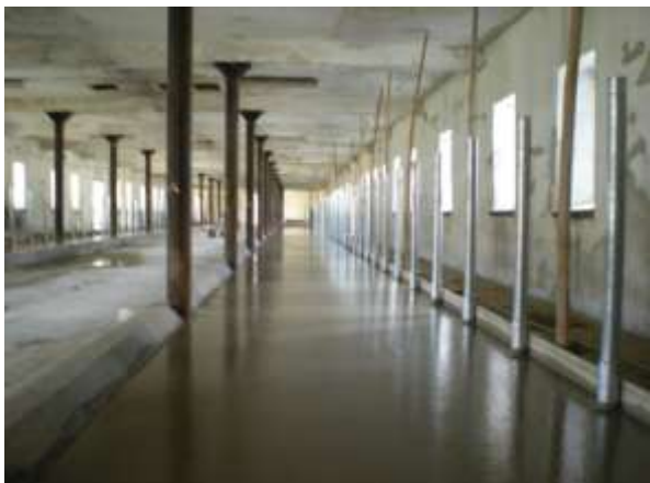
Čerstvě vybetonovaná plocha na Muckově