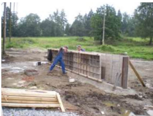
Vzadu se připravuje výstavba hnojného plata ( 6. 8. )