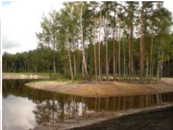
Nově vytvořený ostrůvek

Poněkud pomalejší je přítok vody a tudíž v současné době chybí do normálu 70 cm.