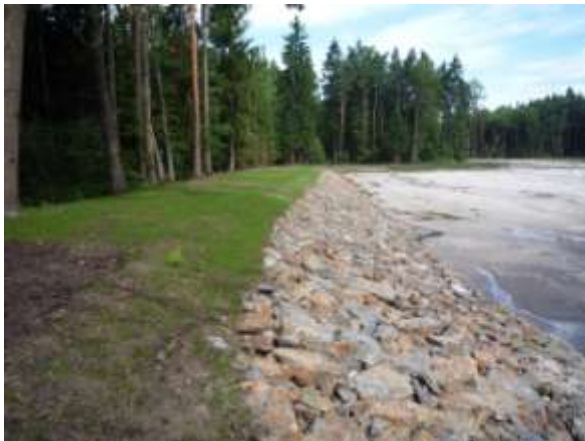
Pohledy na zrekonstruovaný rybník – foto 12. 8. Ing. Michael Sovadina