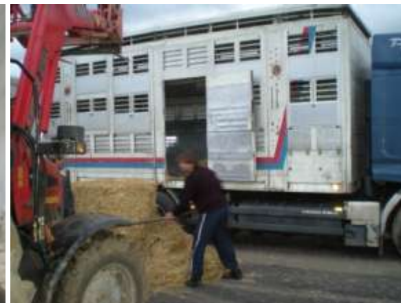
Řidič kamionu si nastýlá vnitřek