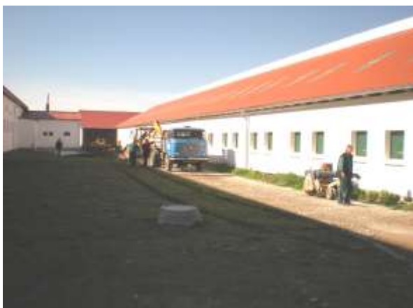
Pohled na prostor odzadu