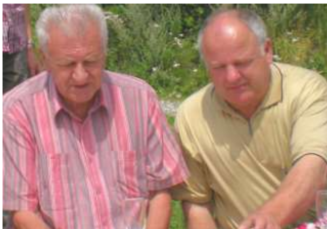
Dva sousední podnikatelé ( 31. 7. 2009 –)