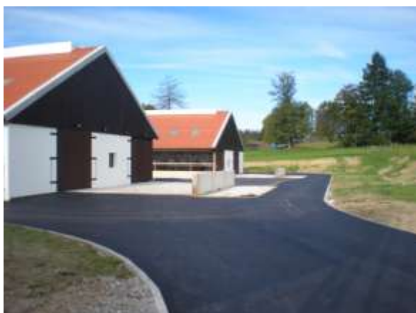
Velmi příjemný pohled na zrekonstruované stáje a plochy kolem nich