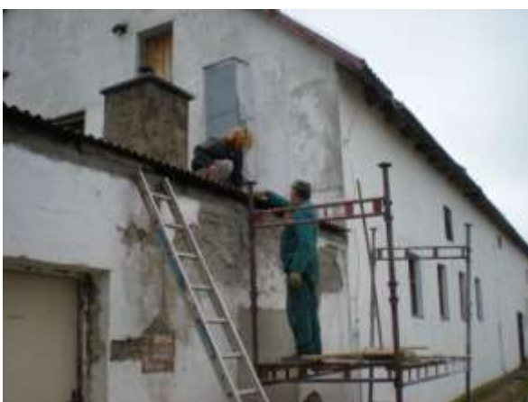
Vpředu se opravuje přístavek