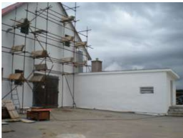
Venkovní pohled z boku a zepředu na stáj č. 3 v Milné