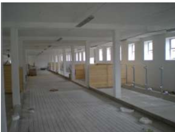
Dva pohledy do dokončované stáje č. 3 na Milné