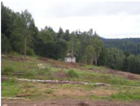
Miroslav Čurda, kterého jsem zachytil u traktoru v jeho bydlišti Pohled na část vytěženého prostoru, odkud se dřevo stahovalo (fota 16.8. – F.Z.)