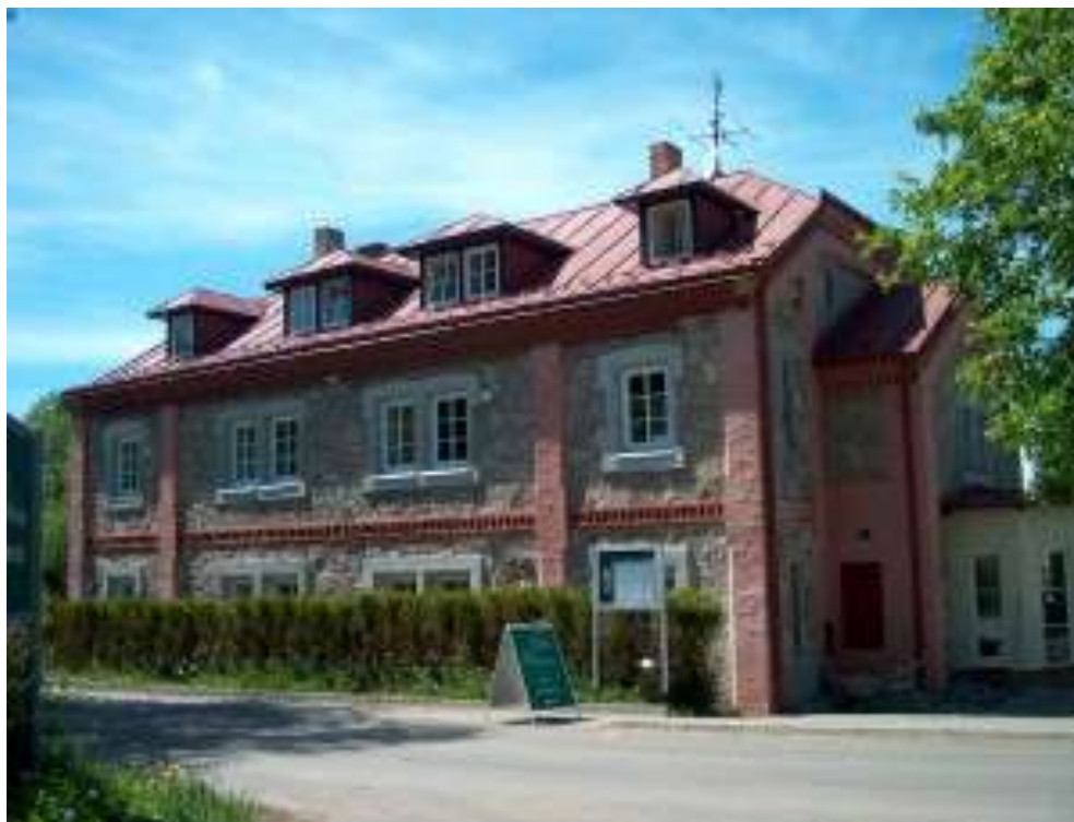
Bývalý statek Jestřábí - dnes moderní hotelový komplex

Ale přežili jsme a jsem ráda, že jsem se dočkala změny v listopadu 1989 !