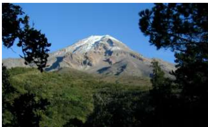
Pico Orizába

Rovněž navštívil vulkán Pico de Orizába vysoký 5600 m, který je také nazýván Hvězdná hora. Známy Popocatepetl viděl jen z povzdálí.