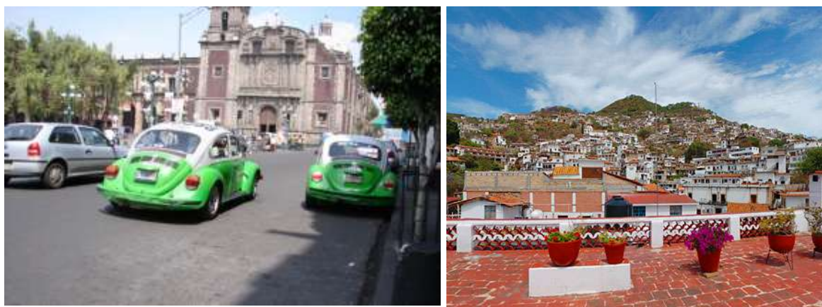
Místní taxíky a město Taxco

Samozřejmě, že od samého počátku fotografoval, zajímala ho především příroda a zajímaví lidé. Fotografoje digitálně s profi zrcadlovkou Canon a fotografií si přivezl kolem 4 000 kusů.