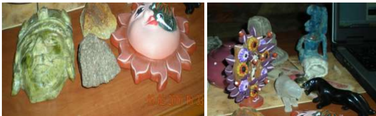
Na obrázcích je část drobností, které si B.Š. přivezl ze svých cest po Mexiku.

Bohuslav Švarc si samozřejmě zakoupil a přivezl některé drobnosti, artefakty, které vyjadřují vztah k Mexiku, jako sluníčko štěstí, strom života, napodobeninu opeřeného hada, mayského bojovníka a také hlídače z pyramid Monte Albána, což jsou figurky jaguárů, kdy černá, která značí dobro, bojuje proti zlu, znázorněnému bílou barvou.