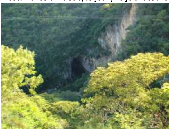
Vchod do jeskyně Grutas de Cacahuamilpa

Po tomto krátkém odpočinku se vydal do jednoho z největších jeskynních systémů na jihu amerického kontinentu. Jeskyně Grutas / + mnoho dalších přídomků/ se nachází asi 50 km od města Taxco a vidět tyto jeskyně je skutečně veliký zážitek.