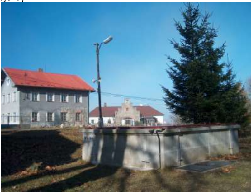
Na návsi v Mokré