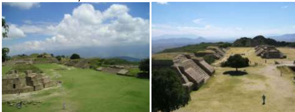
Monte Albán

Dále pokračoval do Puerta Escondida, což je ve státě Oaxaca a pak to samotné Oxacy, hlavního města tohoto státu. Zde navštívil Monte Alban, což je svaté město postavené na hoře 400m nad údolím Oxacy.