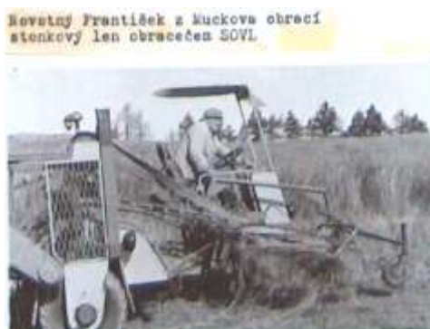
V osmdesátých letech při obracení stonkového lnu