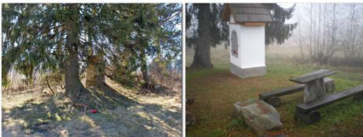
Původní a opravená kaplička na Hubenově stála a stojí v místě, kde Pocklanovi bydleli