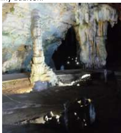
Uvnitř jedné části