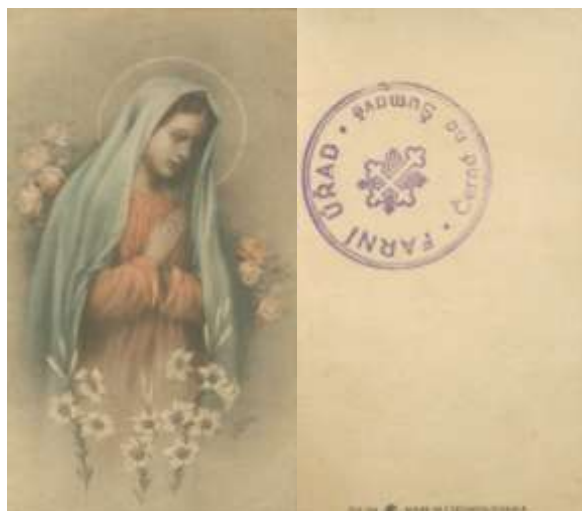
Tento obrázek nám zase uchovává razítko Farního úřadu Černá na Šumavě