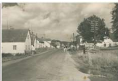
Vjezd do obce ve směru od Horní Plané