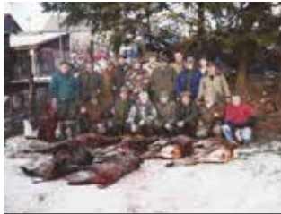
Naháňka na Ořechovce: uloveny 4 laně a 2 ks černé