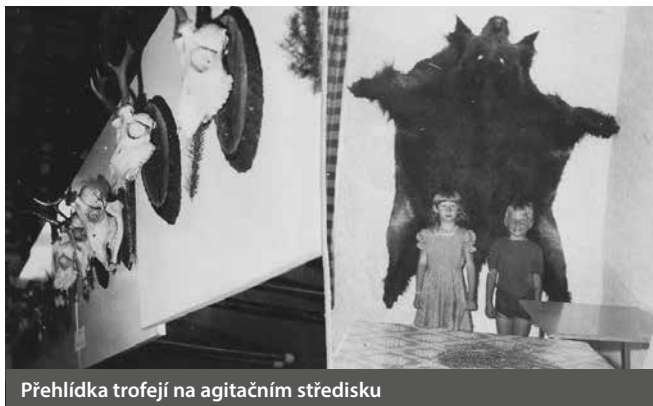
Přehlídka trofejí na agitačním středisku

V roce 1986 byli přijati za členy Švancar a P. Bartoň. V tomto roce se ulovilo 17 srnců, 21 srn a 6 srnčat. Dále 2 lončáci a 4 selata, 1 jelen a 3 laně. Dále 52 bažantů,