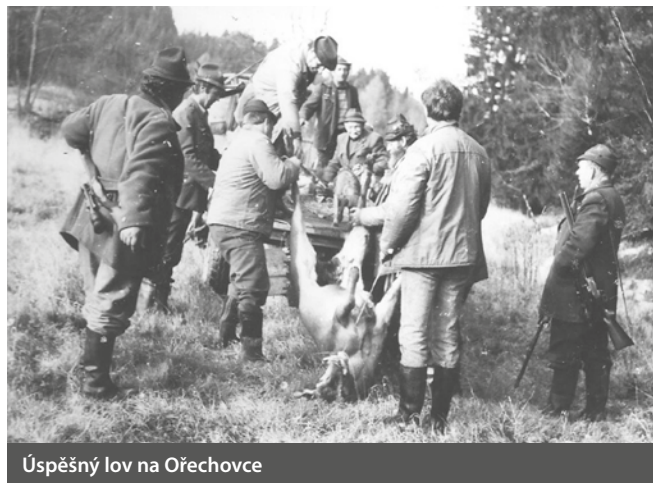
Úspěšný lov na Ořechovce

Zvěřiny pak bylo dodáno 479 kg, což znamená produkci 0,54 kg na 1 ha honební plochy a 60 kg na jednoho člena. Na konci roku mělo MS 75 015 Kčs finančních prostředků.