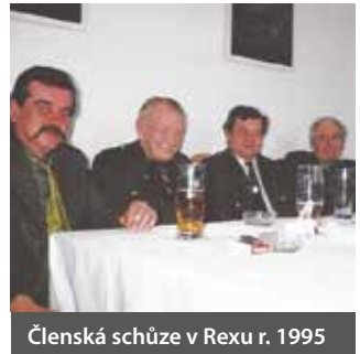
Členská schůze v Rexu r. 1995