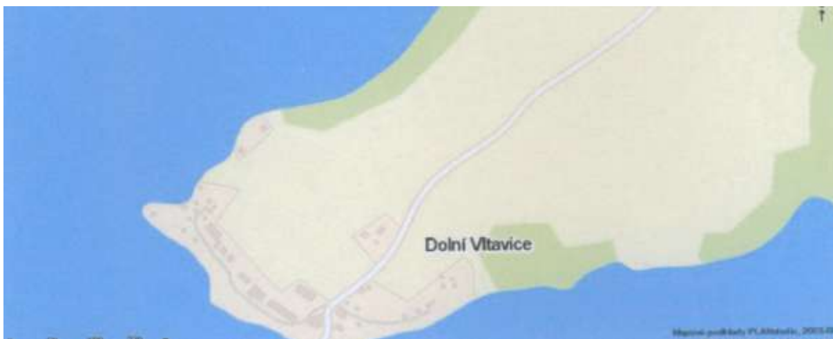
Současný plánek Dolní Vltavice – 2008