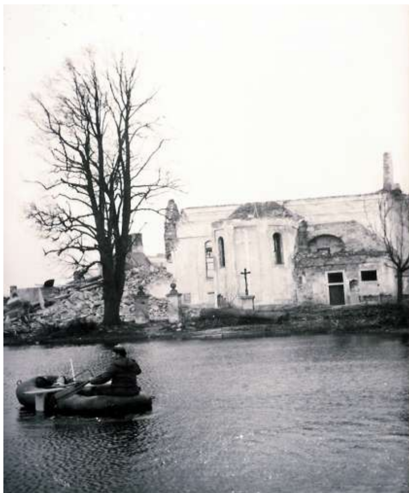
Voda přehrady stoupá