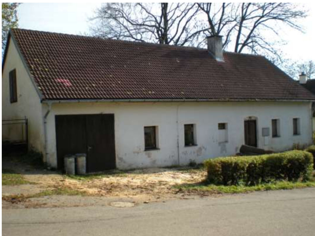
Jeden z původních domů