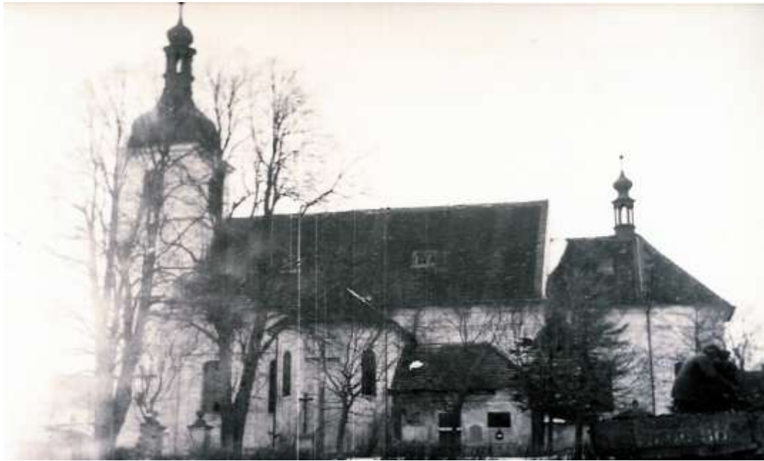
Kostel sv. Linharta