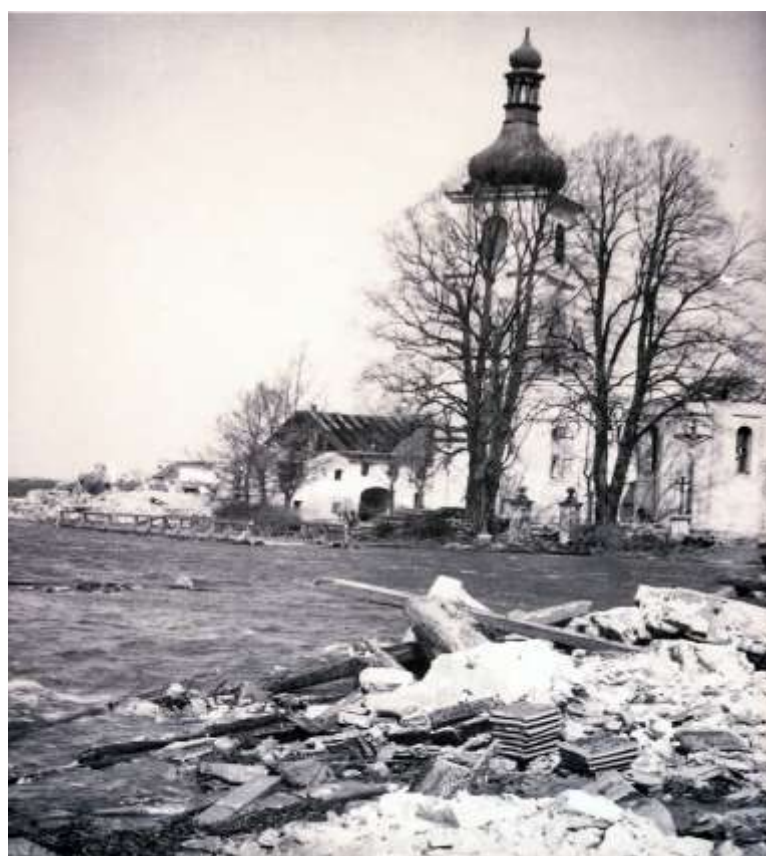
Dolní Vltavice se zaplavuje – postupná demolice