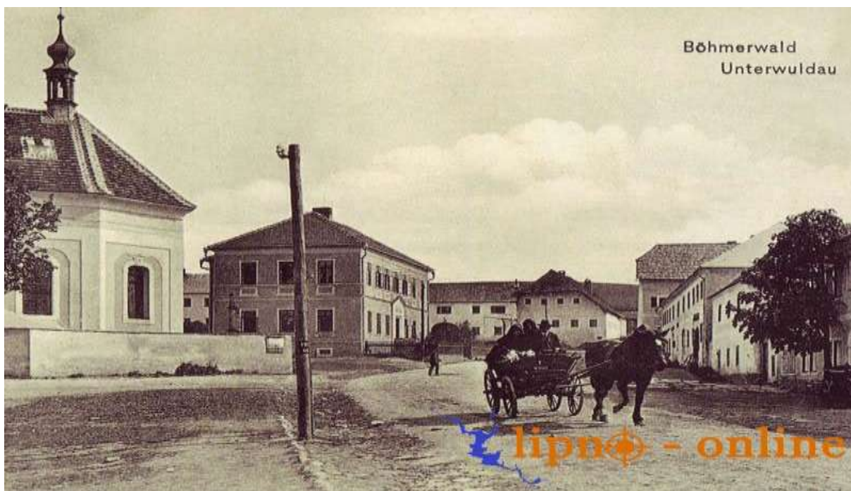
Detail z Dolní Vltavice