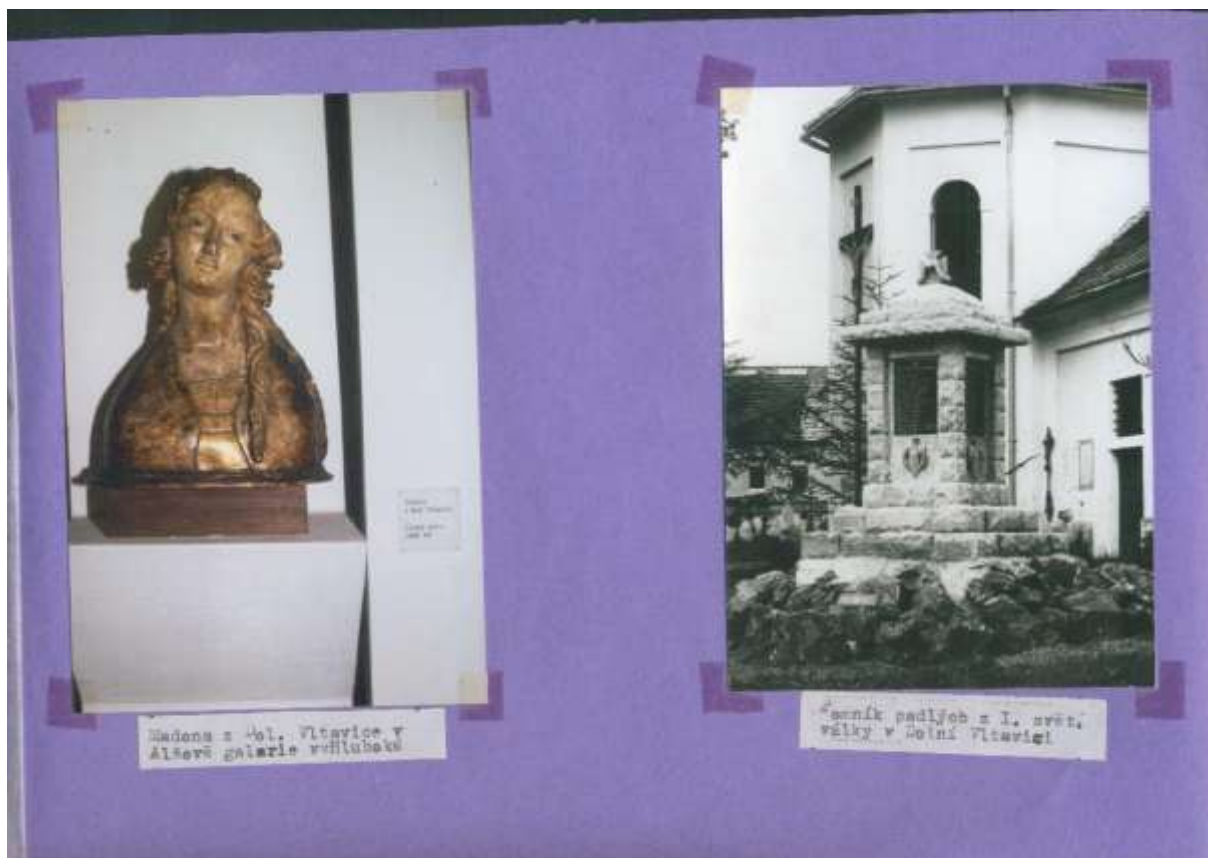
Pomník padlým a Vltavická Madona