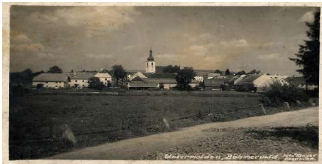
Z roku 1890