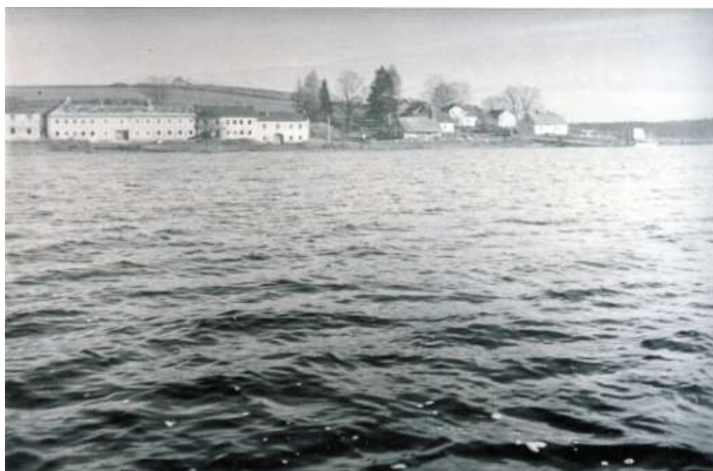
Lipno se naplnilo