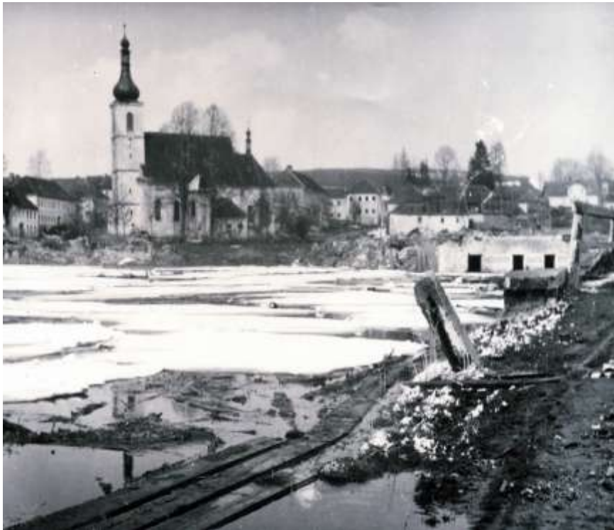
Za chvíli zmizi kostel