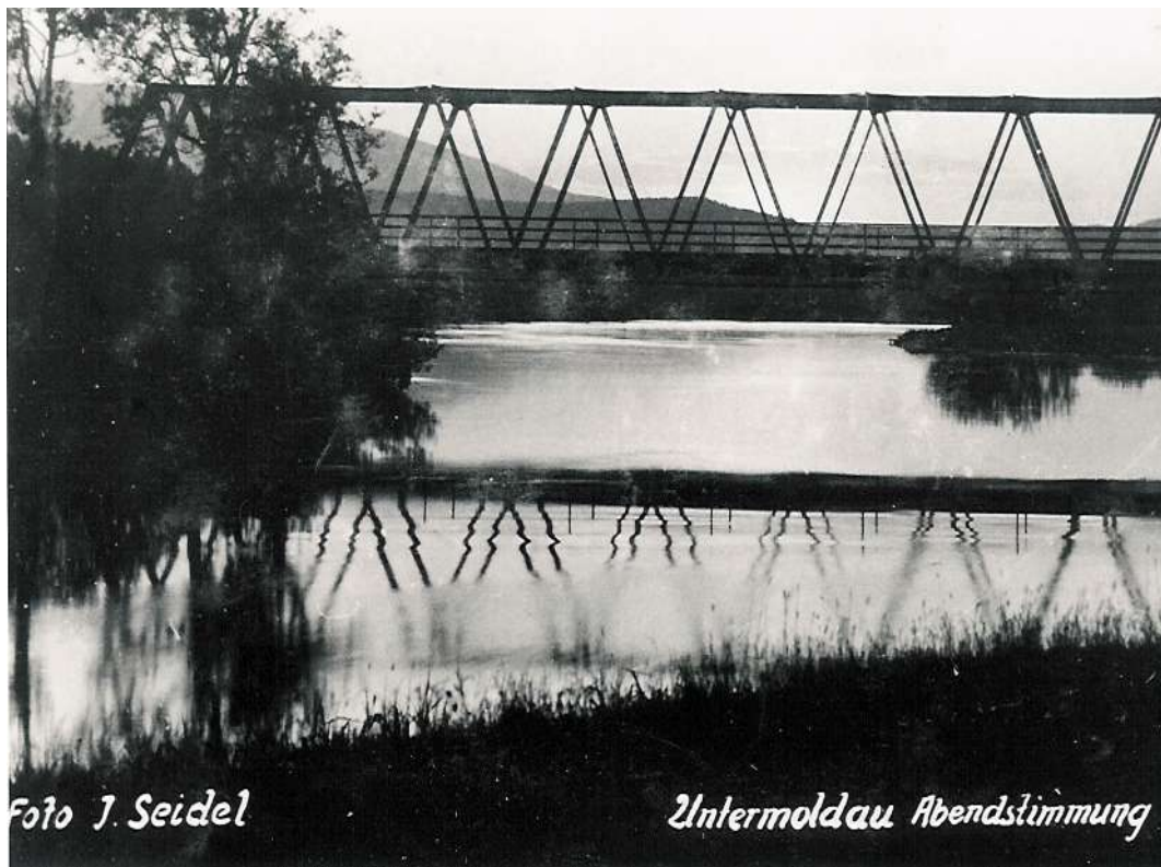
Most přes řeku Vltavu