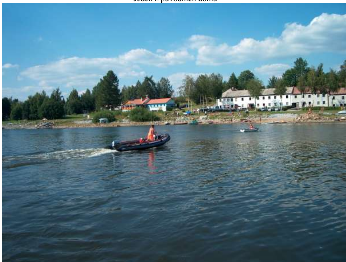
U Dolní Vltavice – současnost - 2005