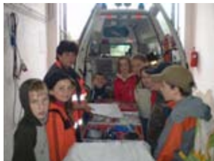
Žáci 5. třídy

ZŠ opět pořádala sběr starého papíru. Kontejner byl velmi rychle naplněn díky našim věrným dodavatelům (tiskárna FOP, samoobsluha Tuty, pošta).