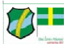
Varianta A :