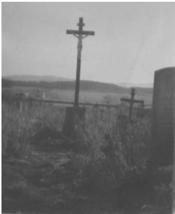
Opuštěný hřbitov po roce 1945

První osídlenci z roku 1945 a 1946, z nichž ještě několik dodnes žije v obci, rádi vzpomínají na krásnou, čistou a po všech stránkách upravenou obec, kdy do ní přišli, na krásné a výstavné budovy se zahrádkami pod okny, na upravené náměstíčko se zeleným trávníkem, na zámožnost a bohatství obce.