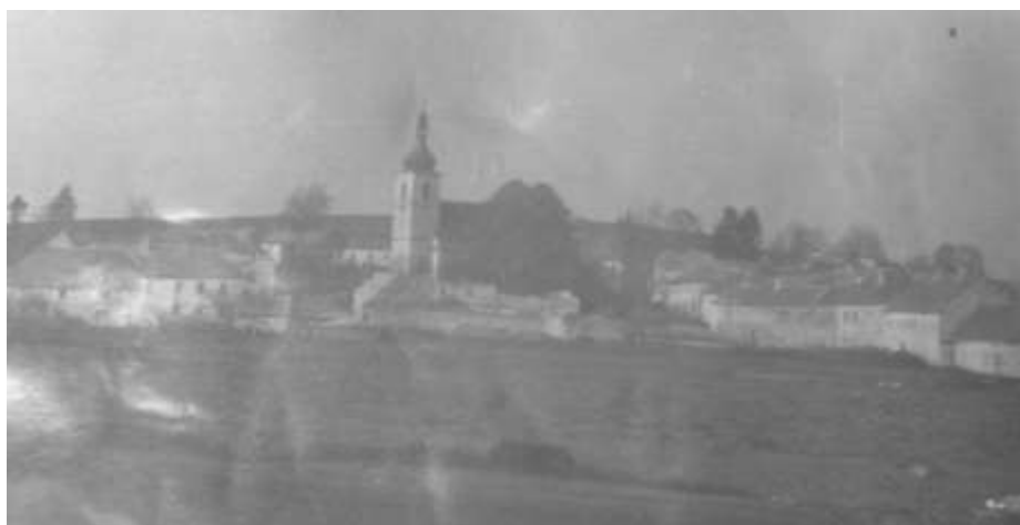
Dolní Vltavice v roce 1955